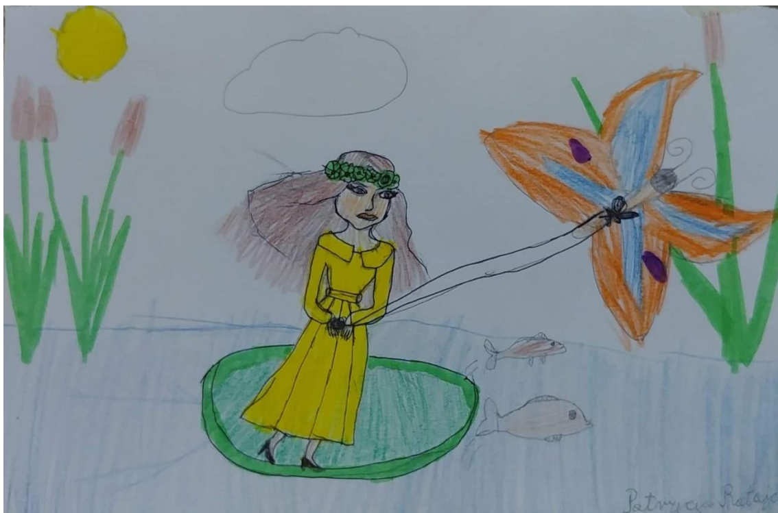
Autor rysunku: Patrycja Ratajczak, uczennica klasy 2b.

Wtem — och, jak się przelęła! Chrząszcz ogromny porwał ją z listka i uniósł het, wysoko, na drzewo.