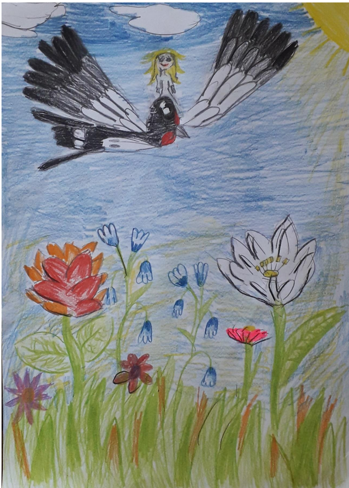
Autor rysunku: Natalia Skarbińska, uczennica klasy 2c.