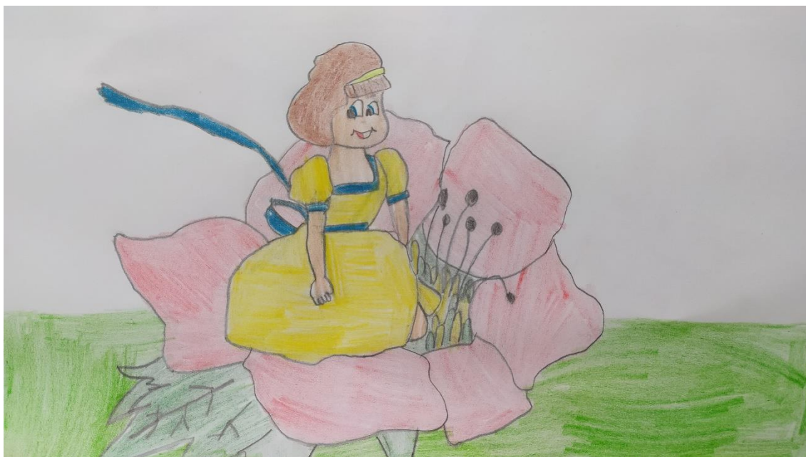
Autor rysunku: Wojciech Pietrowicz, uczeń klasy 2c.

Nazwali ją Calineczką, gdyż była maluchna jak młoda pszczołka, tylko daleko zgrabniejsza.