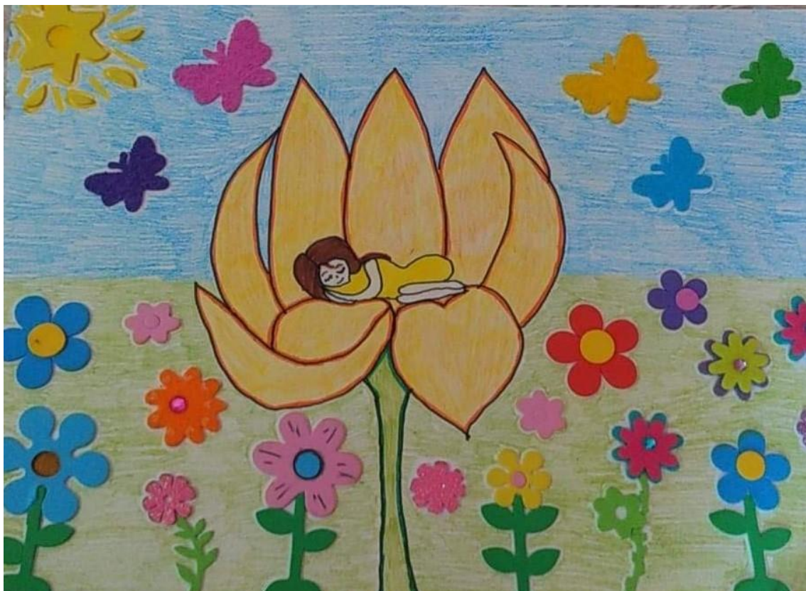
Autor rysunku: Nikola Suszka, uczennica klasy 2b.

— Żegnaj mi, słonko złote! — zawołała i wyciągnęła rączki. — Żegnaj, słonko miłe!