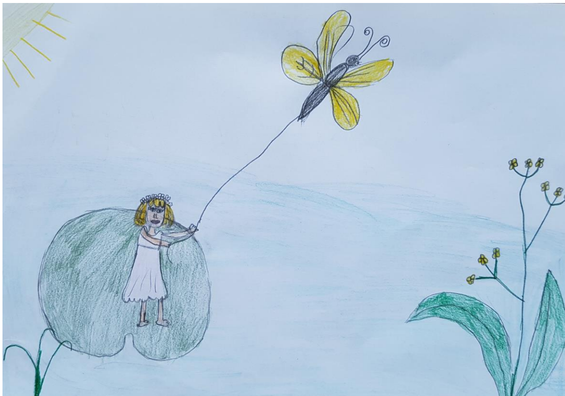
Autor rysunku: Julia Szulkowska, uczennica klasy 2b.

Prześliczny biały motyl usiadł na listku lilii, aby się lepiej przyjrzeć małej dziewczynce. Słońce świeciło ślicznie, woda błyszczała jak srebro, wszystko jej się podobało. Zdjęła swój pasek i przywiązała nim motyla do listeczka. Teraz popłynęła jeszcze prędzej.