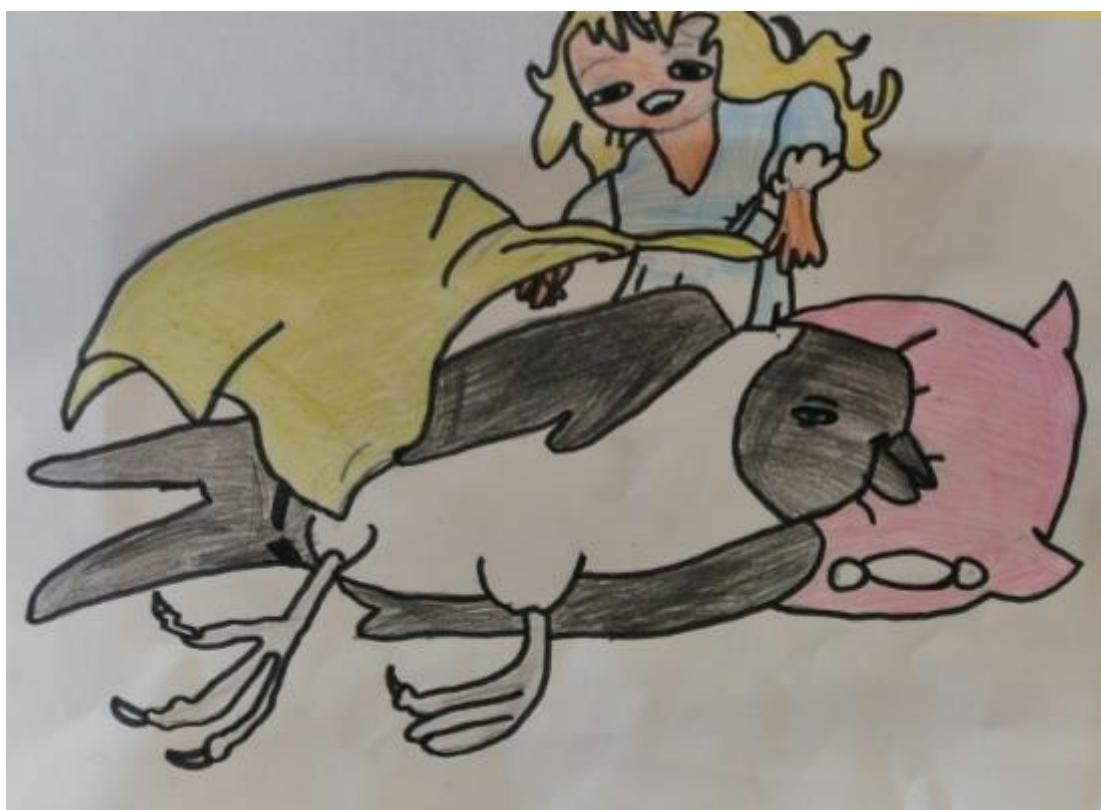
Autor rysunku: Laura Świątnicka, uczennica klasy 2b.

Przez całą zimę dziewczynka troskliwie opiekowała się biedną jaskółką, lecz musiała ukrywać swój dobry uczynek przed kretem i myszą polną, którzy nie lubili ptaszków.