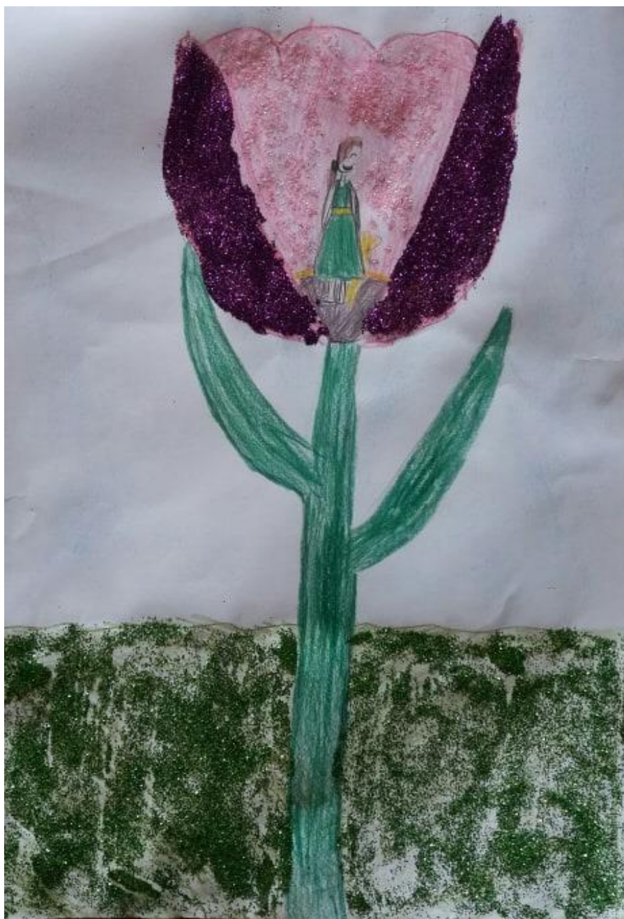
Autor rysunku: Lena Pyrzyk, uczennica klasy 2b.

Zabrali piękną kołyskę i odpłynęli znowu, a Calineczka usiadła na liściu i płakała okropnie, bo nie chciała mieszkać u brzydkiej ropuchy i być żoną jej syna.