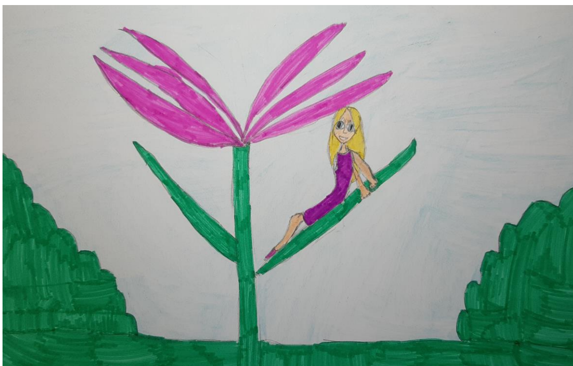
Autor rysunku: Wiktoria Wawrzyniak, uczennica klasy 2c.

Naprawdę Calineczka była bardzo ładna i taką się wydała chrabąszczowi, który porwał ją z listka lilii. Ale gdy wszyscy zaczęli ją ganić, uwierzył też, że jest brzydka, i już chciał jej się pozbyć. Odniósł ją więc na łąkę i posadził na polnym kwiatku, żeby tylko nie mieć jej w domu i żeby sąsiedzi nie śmiali się z jego gustu.