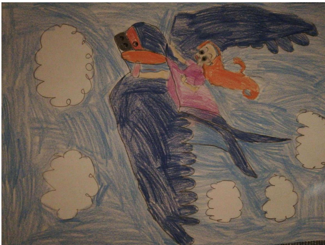
Autor rysunku: Amelia Cierznia, uczennica klasy 2b.

Jaskółka przytuliła się do ziemi, dziewczynka weszła na nią i przywiązała się paskiem do mocniejszych piórek. Potem ptaszek wzleciał w powietrze i płynął ponad lasami, morzami, wznosił się ponad góry, wiecznym okryte śniegiem. Tam było zimno, lecz dziewczynka skryła się pod skrzydełka ptaszka i tylko małą główkę wysunęła, aby widzieć te cuda, jakich pełno na świecie Bożym.